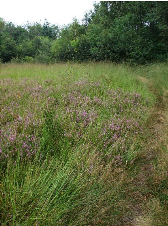
Un particolare della brughiera all'interno dell'Oasi LIPU (fioritura settembre 2008), piccolo lembo superstite dell'antica brughiera detta la Fossarata